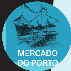
MERCADO DO PORTO