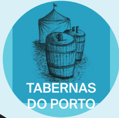
TABERNAS DO PORTO