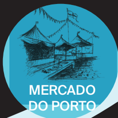
MERCADO DO PORTO