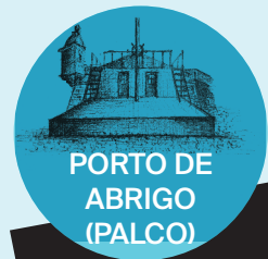
PORTO DE ABRIGO (PALCO)