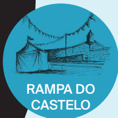
RAMPA DO CASTELO