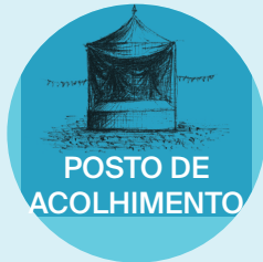
POSTO DE ACOLHIMENTO