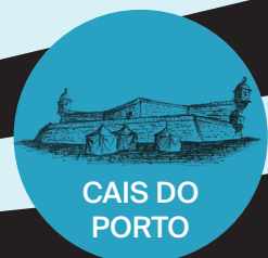
CAIS DO PORTO