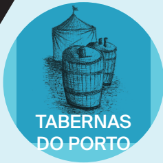
TABERNAS DO PORTO