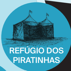
REFÚGIO DOS PIRATINHAS