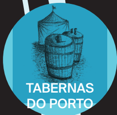
TABERNAS DO PORTO