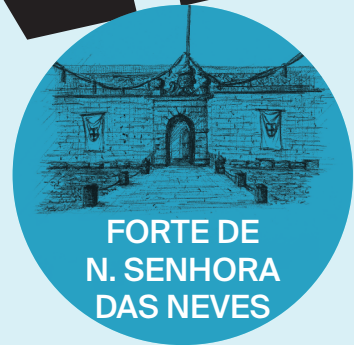
FORTE DE N. SENHORA DAS NEVES