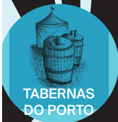
TABERNAS DO PORTO