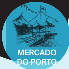
MERCADO DO PORTO